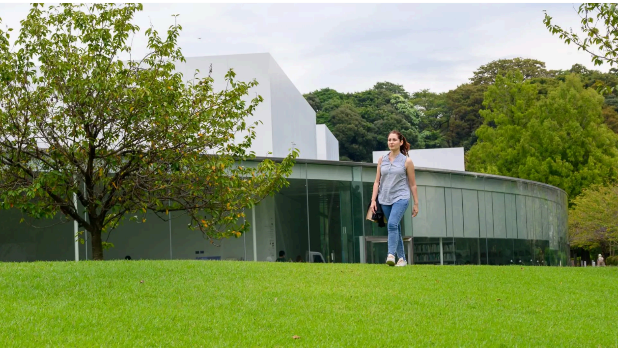
体験型作品が充実の現代アートミュージアム

全国トップクラスの入館者数を誇る現代アートを集めた美術館。恒久展示作品は鑑賞者が作品の一部となって完成する体感型のアートが多く、感性を刺激されます。