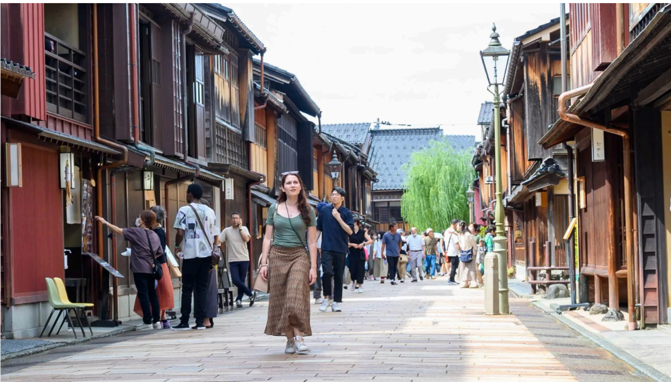
買い物や街歩きを楽しみながら茶屋街の雰囲気を楽しめる

石畳の通りに格子戸のお茶屋建築が連なるひがし茶屋街。19世紀に建てられた建物を公開しているお茶屋もあり、「一見さんお断り」(初めての客は入店禁止)の世界を垣間見ることができます。