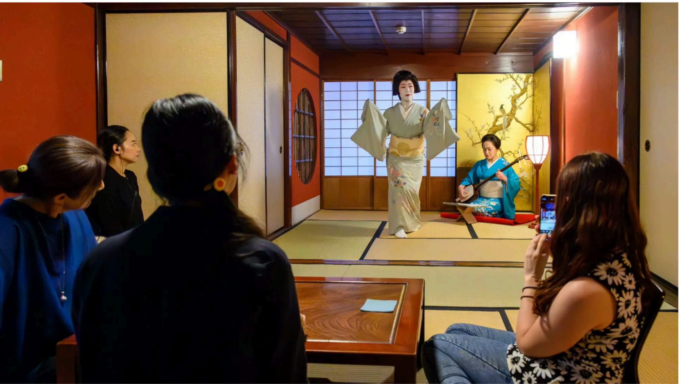
お座敷の花「芸妓」の洗練された芸を愛でる

風情ある町屋で、本格的なお点前と芸妓によるお座敷芸を堪能。「金沢のもてなし」を心ゆくまで楽しむことができます。