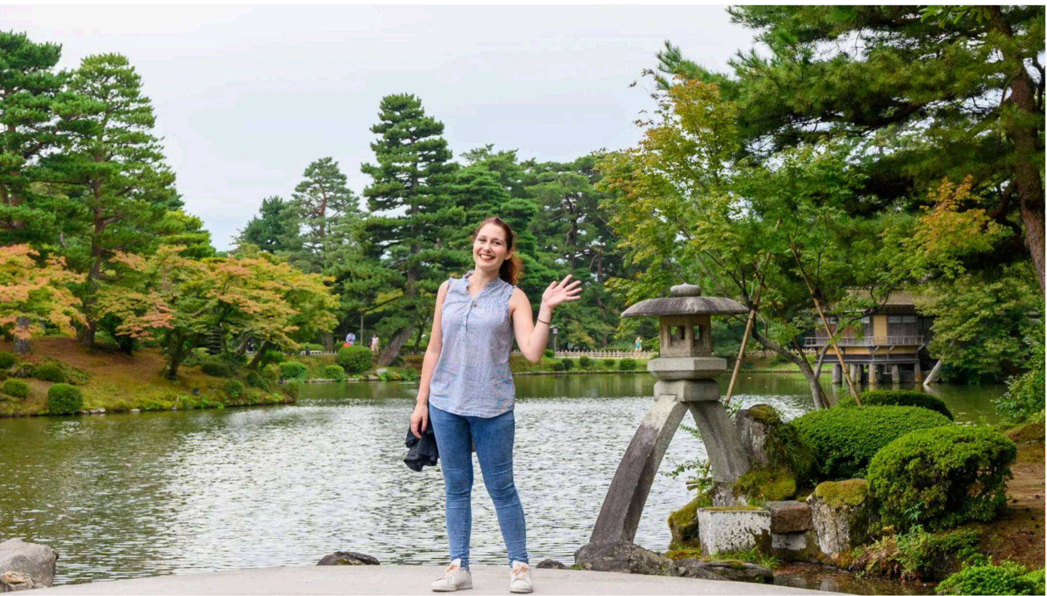
日本三名園の一つに数えられる武士が作った兼六園を歩く

兼六園は17世紀、加賀藩の殿様のために金沢城の外に配置した庭として整備したのが始まり。中央に大きな池をつくり、池の周りを歩いて巡り、庭を楽しむ武家文化の庭園です。