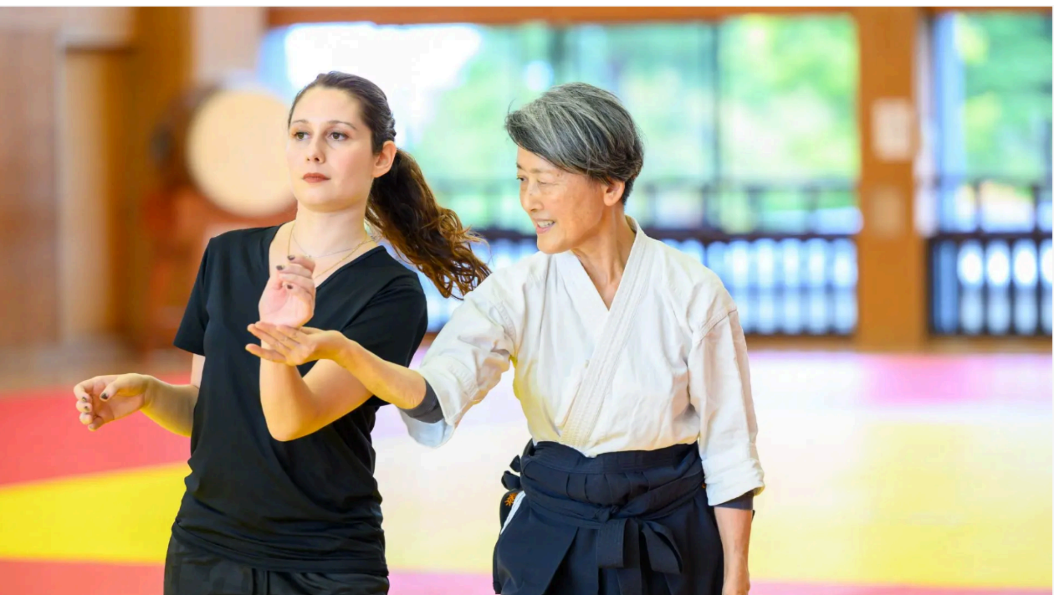
「力の要らない」合気道を体験

合気道は「戦わない武道」。「武道には興味があるけれど、自分がやるにはハードルが高い」と感じる女性に、腕力と体力を必要としない合気道はぜひ体験してほしい武道です。