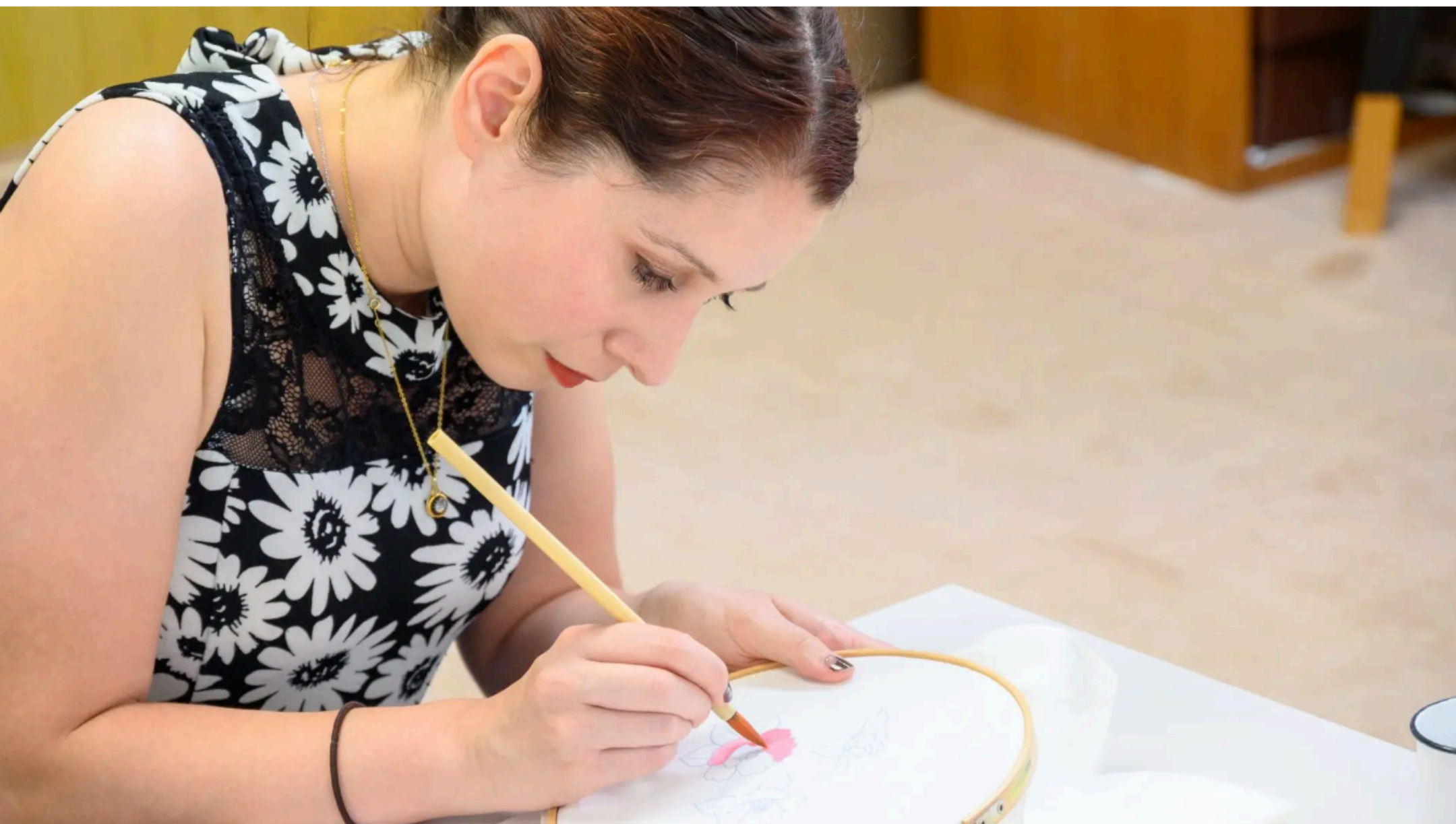
筆先に集中して加賀友禅職人気分

雨や雪が多い金沢だからこそ、色鮮やかに彩られた加賀友禅。その工房を訪ね、本物の素材や道具に触れて、ここでしかできない体験に挑戦してください。