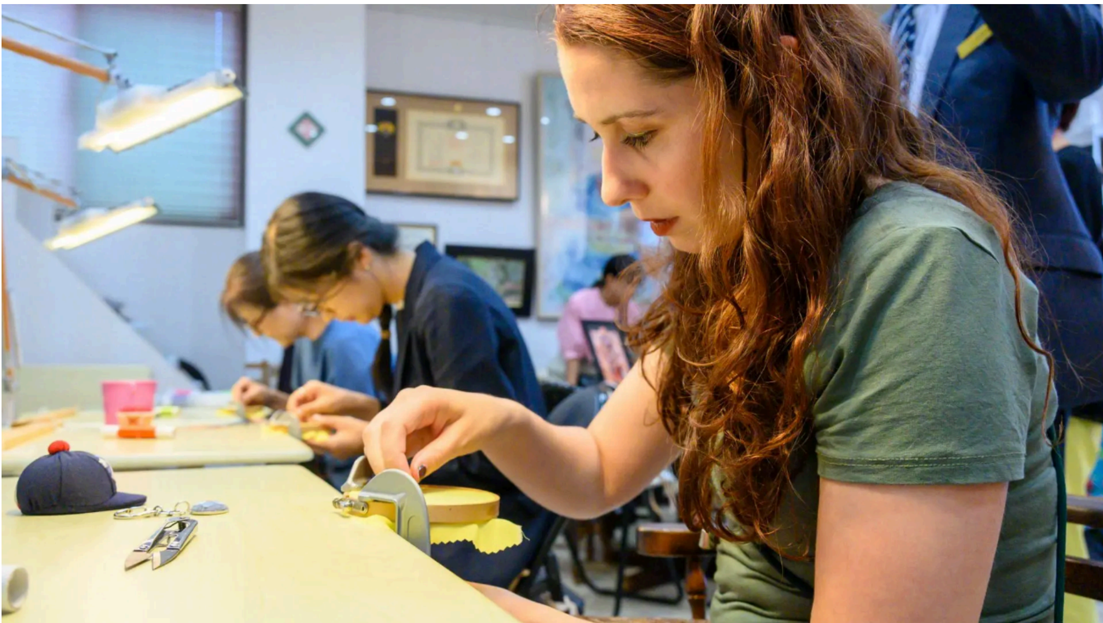
武士の時代から守り継がれた手縫いの技を体験

手縫いで作り出される華麗で繊細な「加賀繻」。その伝統技法を石川県で受け継ぐ工房で、糸が生み出す美しいアートと出会うことができます。